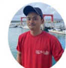
海藻お兄さん・宮代