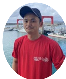
海藻お兄さん・宮代